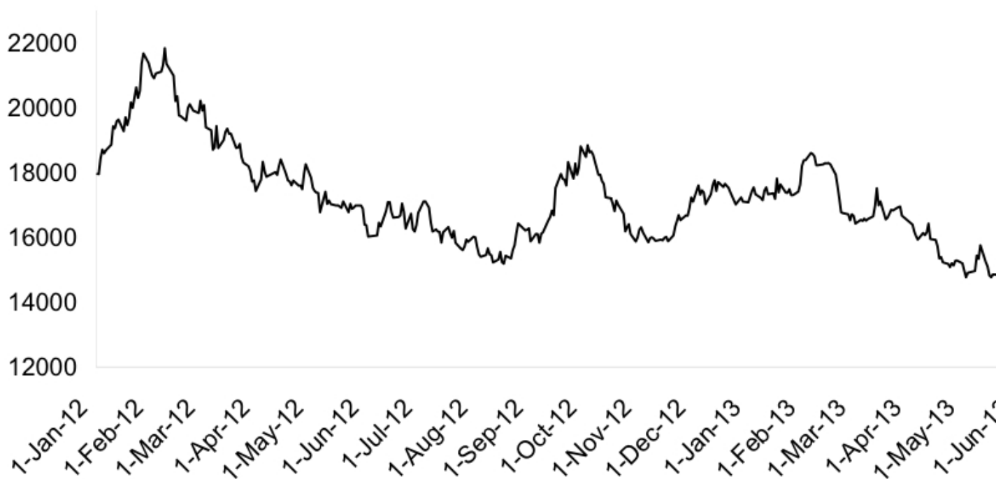
Nickel - LME ($/tonne)

Le prix du nickel, qui a chuté de près de 15% depuis janvier dernier au London Metal Exchange a fortement influé sur le montant des primes d'alliages.